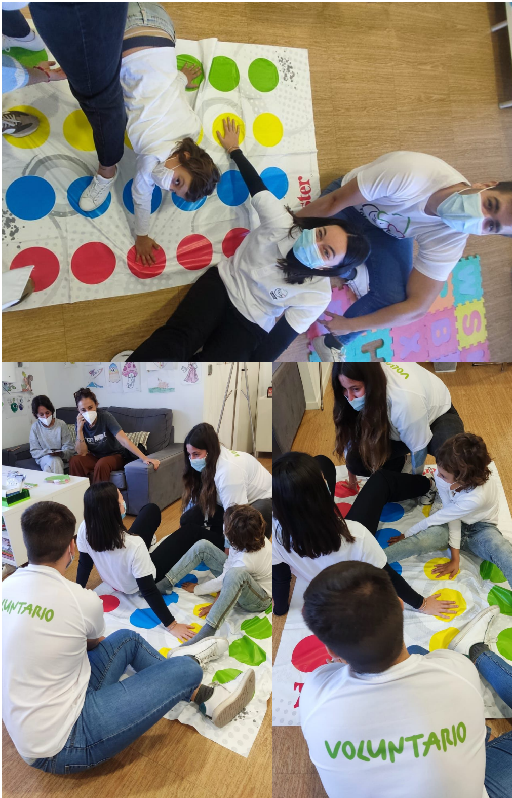
Nuestros voluntarios y voluntarias jugando al Twister con los peques en la Sala Blanca.